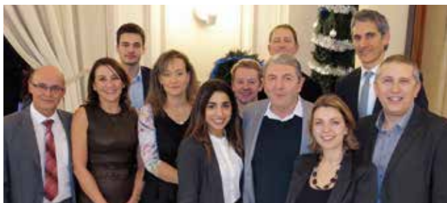
Le profil pluridisciplinaire des participants permet d'améliorer la pratique de chacun.