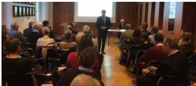
Une conférence sur le burn out des soignants a clôturé la journée.