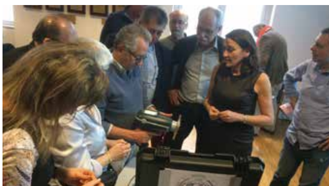
Les membres de l'UIO bénéficient de formations annuelles.