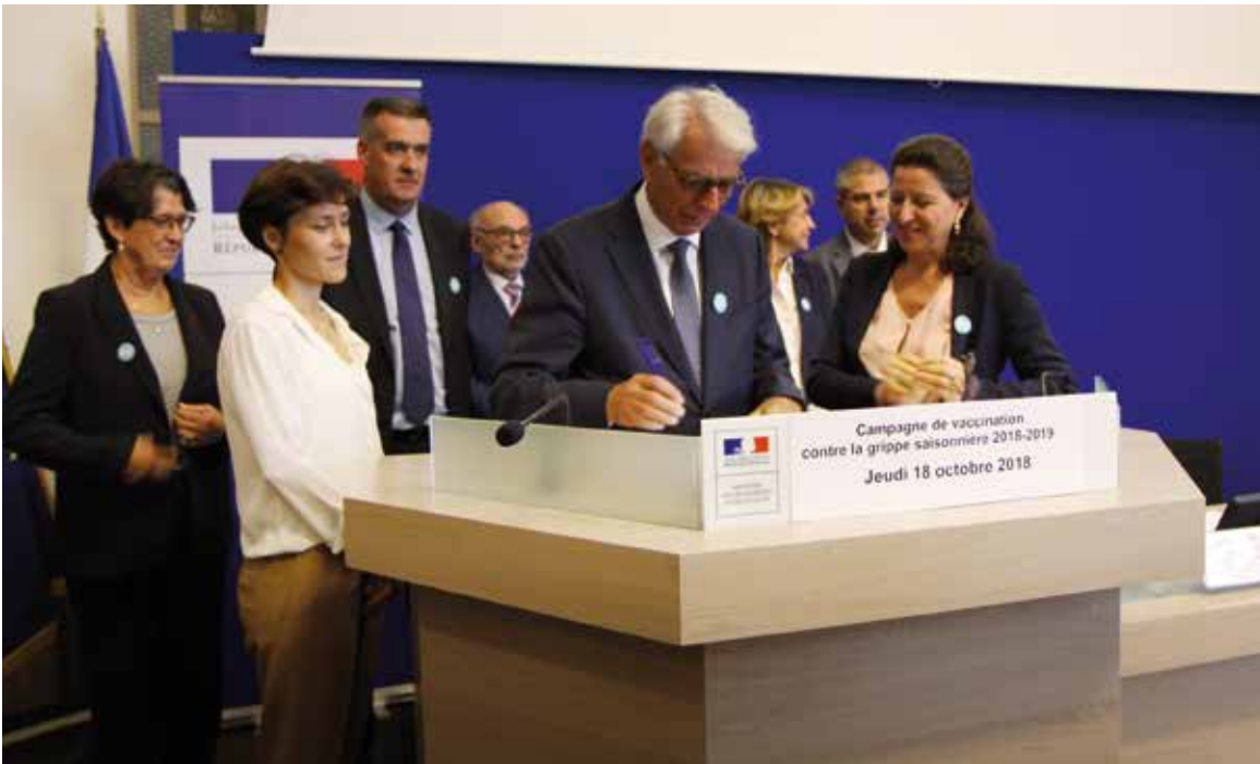
Serge Fournier, président du Conseil national, aux côtés d'Agnès Buzyn et de ses homologues des Ordres de santé, signant la charte en faveur de la vaccination des professionnels de santé.