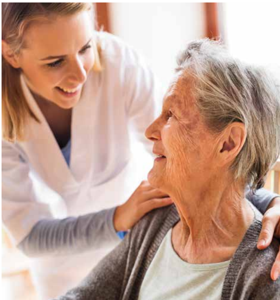
La télémédecine bucco-dentaire constitue une réponse concrète et efficace en matière de téléconsultation des personnes résidant en Ehpad.

Via notamment e-Dent à Montpellier, la télémédecine bucco-dentaire commence à essaimer dans le territoire national. Un déploiement dans le cadre duquel les praticiens libéraux commencent à s'investir, ce qui constitue un enjeu majeur dans le développement de ces nouvelles pratiques. En effet, la télémédecine est ouverte à tous les types d'exercice. En Bretagne, deux praticiens membres d'un réseau pour la prise en charge de personnes à besoins spécifiques pratiquent des actes de télémédecine de même qu'un chirurgien-dentiste dans les Hauts-de-France et, enfin, deux confrères en région Paca.